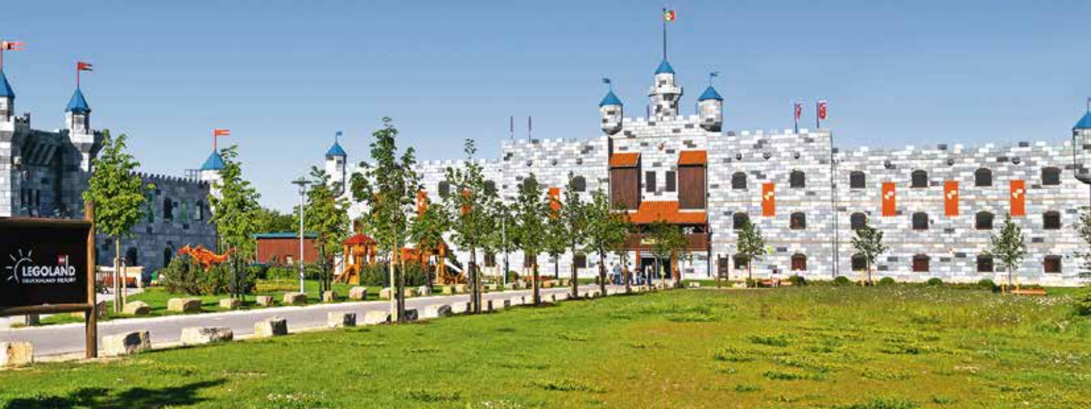
Das Hotelensemble „Ritterburg“ (li.) und „Königsburg“