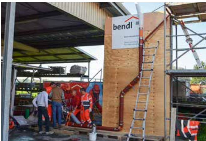
Installation für die DIBt-Zulassung des Inhouse-Systems

In den vergangenen Wochen wurde bei uns im Bauhof die Installation des Inhouse-Systems der Firma VFG Giengen/LineTec, zur Erlangung der DIBt-Zulassung simuliert. Hier geht es um die Komplettanierung von Abwasserleitungen im Gebäude . Ein völlig neues System, das sehr vielversprechend scheint. Wir dürfen gespannt sein, wie es hier weiter geht.