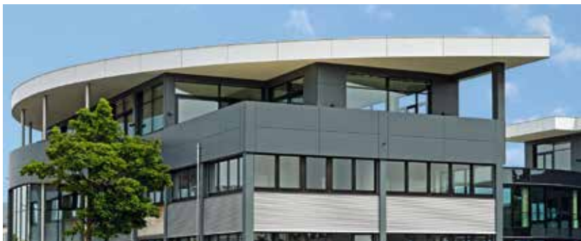
Ein Blickfang: die Dachelemente der Firma Kögl, Bubesheim