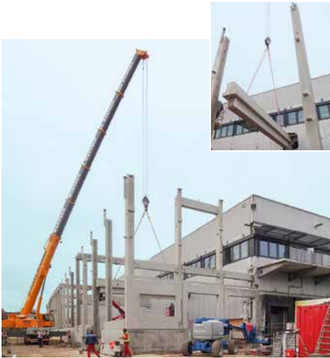
Erweiterung bei CHEFS CULINAR, Zusmarshausen