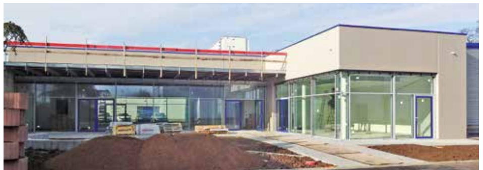
Seminargebäude der Günzburger Steigtechnik Munk