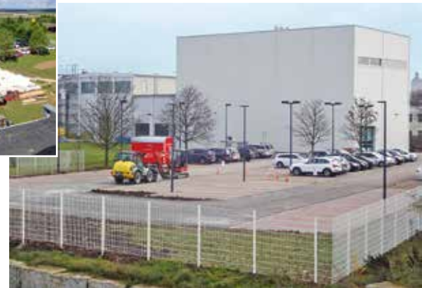
Neue Halle mit Außenanlagen Firma Verotec GmbH, Lauingen