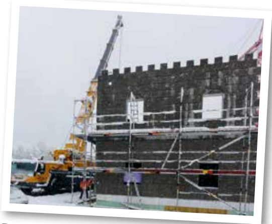
Die „Ritterburg“ als Winterbaustelle