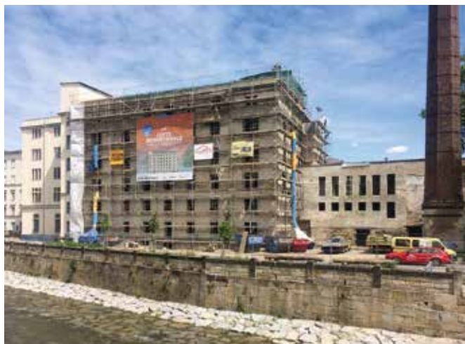
Denkmalgeschützte Bienert-Mühle in Dresden

Eine besondere Herausforderung sind die Sanierungs- und Umbauarbeiten in der alten, 1569 erbauten kurfürstlichen Hofmühle in Dresden-Altplauen. Im Zuge der Arbeiten entstehen in diesem historischen, denkmalgeschützten Fabrikgebäude anschließend 35 moderne Loft-Apartments auf 6 Etagen. Unter anderem bauen wir hier neue Decken, einen Fahrstuhl und ein neues Dachgeschoß ein. Arbeiten, die viel Fingerspitzengefühl und Fachkenntnis erfordern.