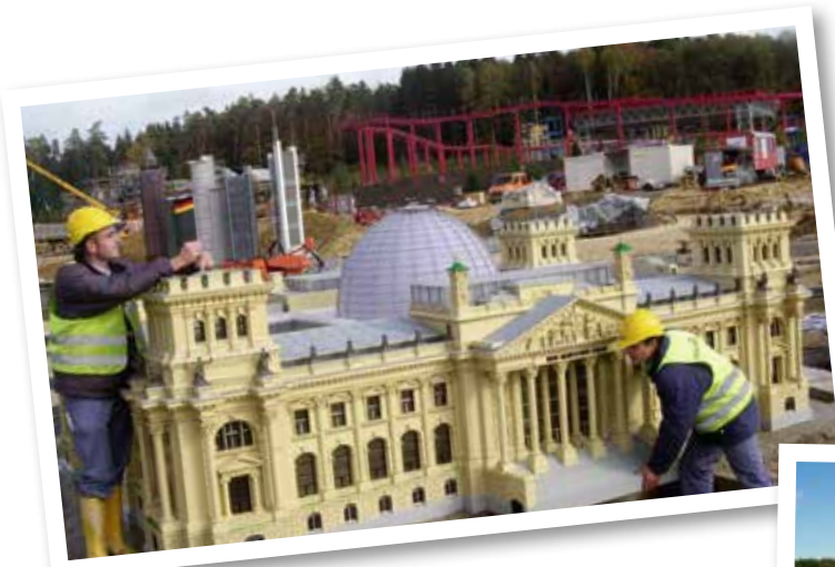
Das MINILAND entsteht