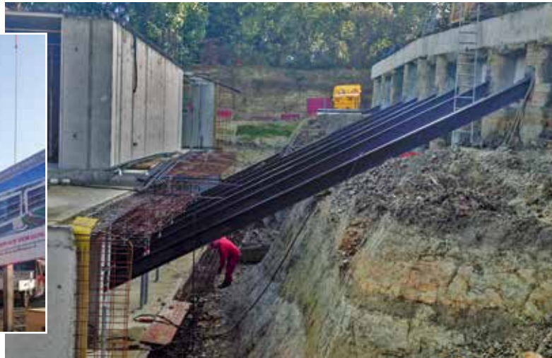
Massive Abstützmaßnahmen bei der Wohnanlage Mörk in Ulm-Reutti