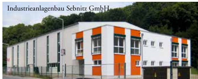
Industrieanlagenbau Sebnitz GmbH

Bereits zum 3. Mal arbeiten wir für die Firma SUSA S. Sauer GmbH. Aktuell übernehmen wir die Fundamentierung für eine weitere Produktionshalle in Heidenau und sind natürlich sehr stolz, diese Firma mittlerweile zu unseren Stammkunden zu zählen, bestätigt uns dies doch in der Qualität unserer Arbeit.