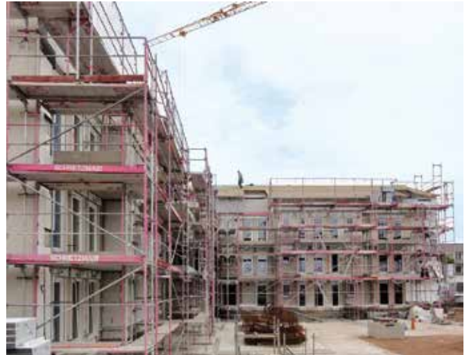
Wohnanlage der Firma IDEA-Plan in Augsburg-Göggingen