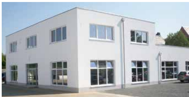
Autohaus Adler, Ottendorf-Bahretal

Die Auftragsbücher sind bis Ende des Jahres voll und das erfordert von unseren Mitarbeitern vollen Einsatz. Damit wir die Bauvorhaben planmäßig abschließen können sind auch immer wieder Überstunden fällig. Hier zeigt sich aber zum wiederholten Mal, dass auf unsere Kollegen Verlass ist und sie hinter ihrer Firma stehen. Dafür können wir nicht genug „Danke“ sagen und hoffen, dass wir auch 2015 gemeinsam wieder so erfolgreich arbeiten werden. Unser Umsatzziel von 6,5 Mio. Euro haben wir durch die gute Auftragslage bereits im Herbst erreicht und können uns voll auf die neuen Aufgaben des Jahres 2015 konzentrieren.