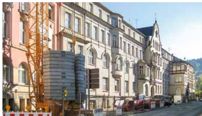
Betreute Wohnanlage „Schiller-Appartements“ in Sebnitz

pünktlich übergeben wurden. Hier zeigten sich wieder einmal die Vorteile von Planen und Bauen aus einer Hand. Wir würden uns sehr freuen, wenn sich dieser Trend in Zukunft verstärkt und wir hier unsere Erfahrung einbringen können.