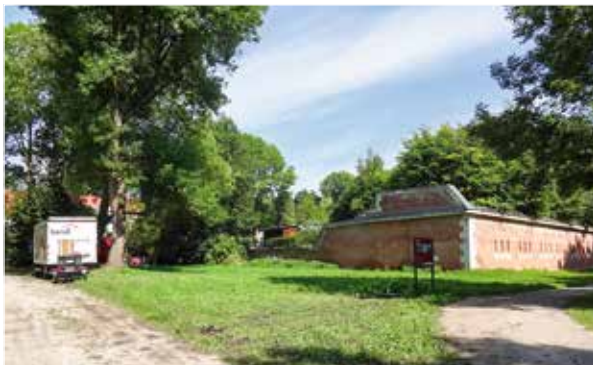
Sanierung im Bereich der historischen Festungsbauten

■ Die Abwasserleitungen im Bereich der geschichtsträchtigen Festungsbauten aus dem 19. Jahrhundert der Landesfestung Ingolstadt waren marode. Dort, wo in den anschließenden Künettegraben seit 1971 das Donau-Nebenflüsschen Schutter eingeleitet wurde, musste saniert werden. Unser Auftraggeber, die Ingolstädter Kommunalbetriebe, sind hier in jeder Richtung vorbildlich. Bereits seit Jahren sanieren sie kontinuierlich ihre Kanäle und haben erkannt, dass Investitionen in präventive Maßnahmen unter dem Strich Geld sparen und die Bürger zufrieden stellen. Eine erfreulich um- und weitsichtige Behörde! Damit in dem sensiblen, Wasser führenden Umfeld des Künettegrabens, in dem Denkmalschutz, Naherholung und Naturschutz aufeinander treffen,