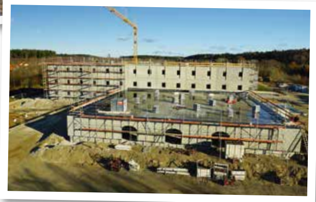
Die „Königsburg“ mit Gastronomie-Bereich im Rohbau