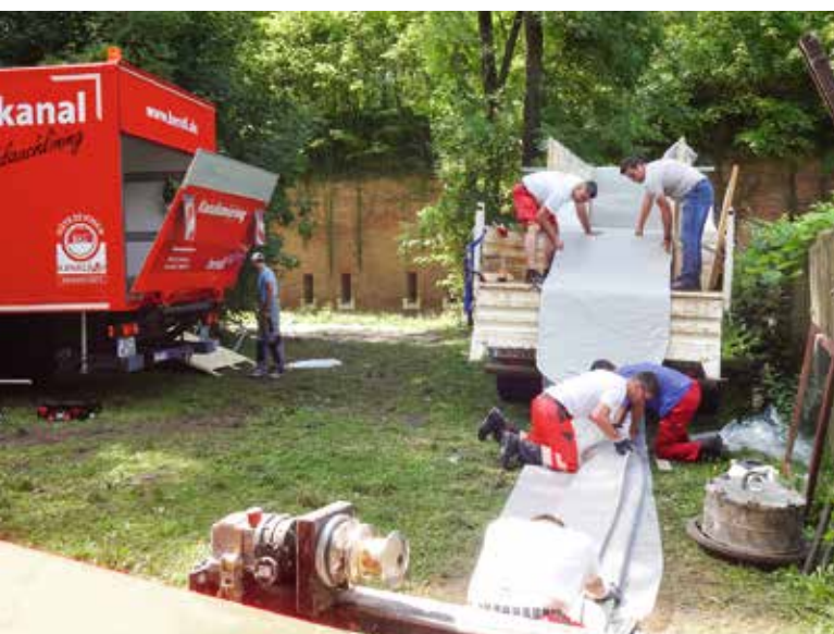
Der Schlauchliner wird direkt vom LkW in den Schacht geführt