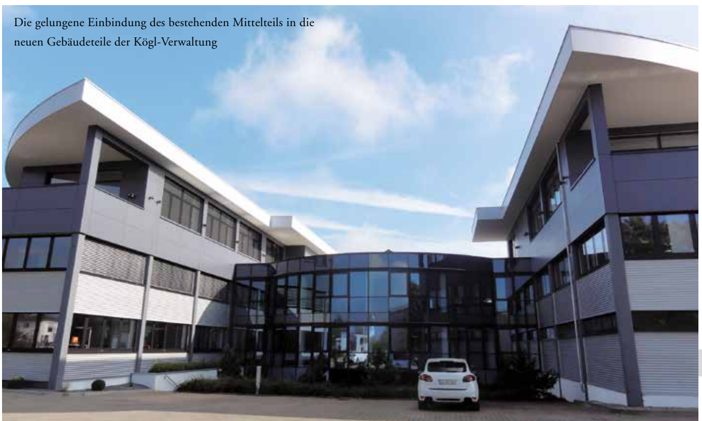
Die gelungene Einbindung des bestehenden Mittelteils in die neuen Gebäudeteile der Kögl-Verwaltung