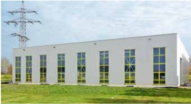
Neue Halle Firma GTG, Gundelfingen

Hier haben wir für Sie gebaut... Ein Streifzug durch unsere Baustellen