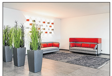
Einladender Wartebereich für Gäste