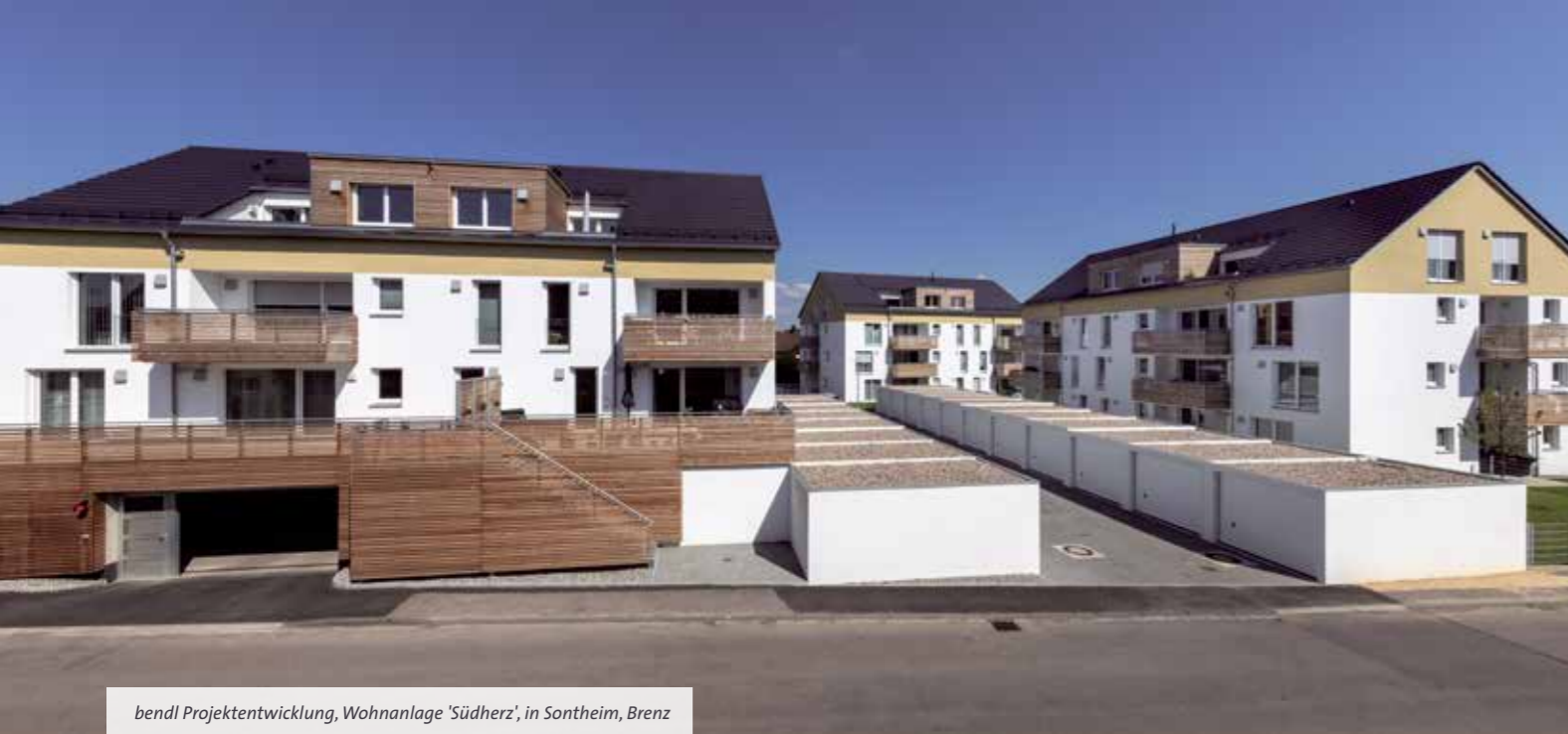
bendl Projektentwicklung, Wohnanlage 'Südherz', in Sontheim, Brenz