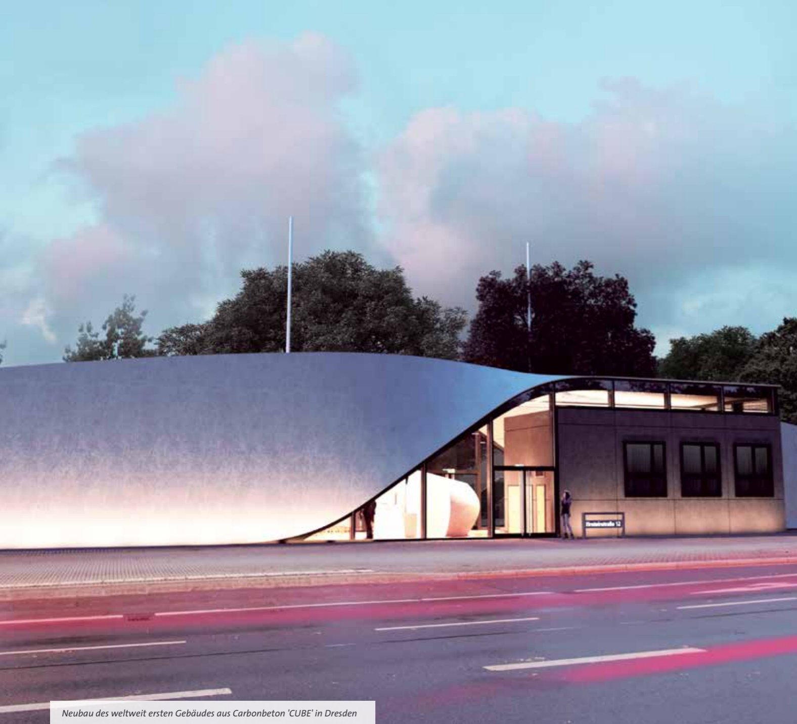
Neubau des weltweit ersten Gebäudes aus Carbonbeton 'CUBE' in Dresden